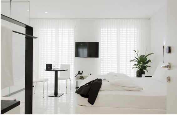
homeSTUDIO ohne Küche, mit Nutzung Loftküche 25 m2

Studios und Comfort-Studios sind ohne In-Room Küche, die sophie'sWOHNKÜCHE ist der Treffpunkt für alle geselligen Gäste, die bei uns wohnen.