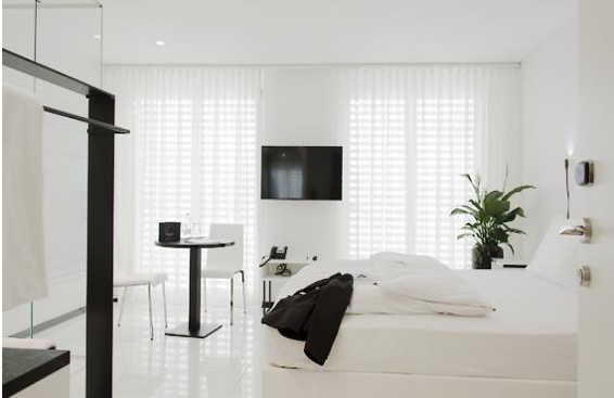
homeSTUDIO ohne Küche, mit Nutzung Loftküche 25 m2

Studios und Comfort-Studios sind ohne In-Room Küche, die sophie'sWOHNKÜCHE ist der Treffpunkt für alle geselligen Gäste, die bei uns wohnen.