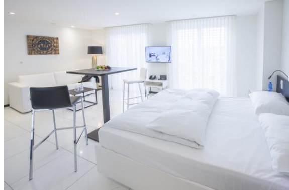
homeCOMFORT-STUDIO ohne Küche, mit Nutzung Loftküche, 30 m2