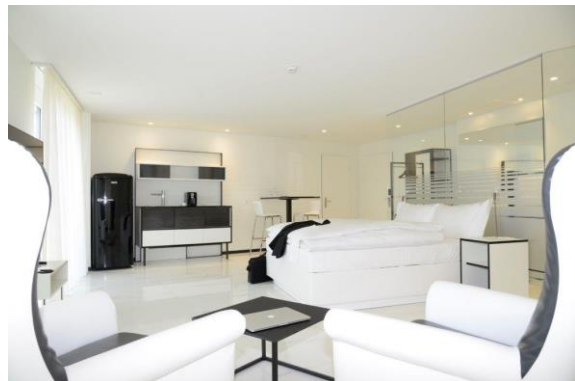
homeSUITE mit In-Room Küche, 44-46 m