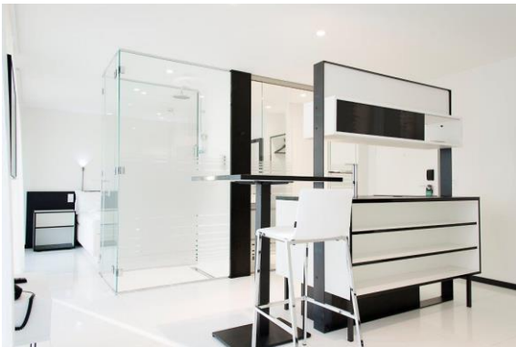
homeAPARTMENT mit In-Room Küche, 33-39 m2